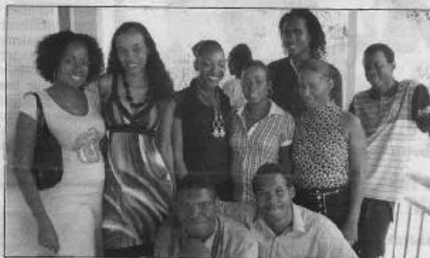
Des jeunes motivés et heureux ! Leurs sourires en disent long et l'espoir a refait surface chez certains d'entre eux, jusqu'à présent désœuvrés.

■ Renseignements : École Martinique Sud, quartier Majeur, Rivière-Salée, Tél. 0596.68.02.52.