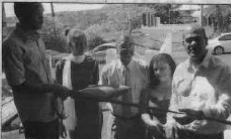
Le traditionnel coupe du ruban, effectué par les responsables de la structure comme le coordinateur d'un projet éducatif porté à bout de bras durant des mois.