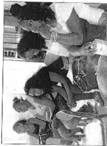
Au jeu des questions-réponses, les stagiaires répondent aux questions de l'animateur basé sur le système sanguin et le cœur en prévision de cette intervention avec l'une de leurs professeurs.

Durant cette année 2016, plusieurs autres projets pédagogiques seront proposés, à l'issue de la manifestation : l'atelier de la découverte des métiers, la journée des métiers, la journée de la santé, la journée de la culture, la journée de la citoyenneté, la journée de la solidarité, la journée de la responsabilité.